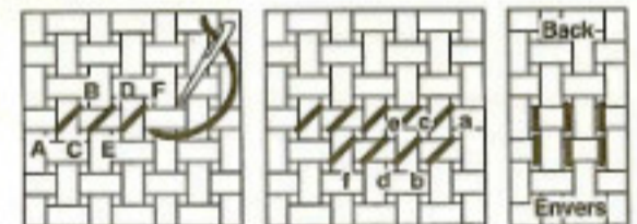
(Back) Parte Trasera, Averso, Rückseite, Achterkant, Обратная сторона

When working the second row of stitches, remember to stitch from the top right hole to the bottom left hole. Correct Half Cross Stitches create small vertical stitches on the back of the fabric.